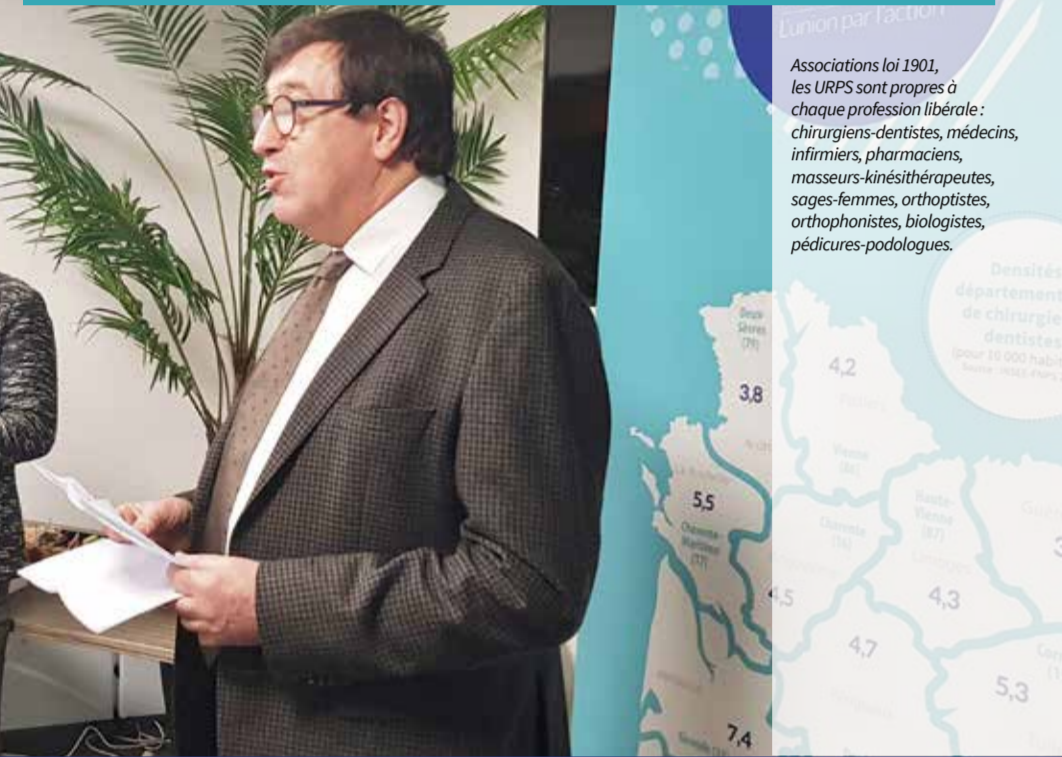
Associations loi 1901, les URPS sont propres à chaque profession libérale : chirurgiens-dentistes, médecins, infirmiers, pharmaciens, masseurs-kinésithérapeutes, sages-femmes, orthoptistes, orthophonistes, biologistes, pédicures-podologues.

8 départements sur 12 avec une densité de chirurgiens-dentistes libéraux inférieure à la moyenne nationale